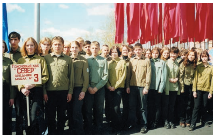
Второе поколение северян – выпуск 1998