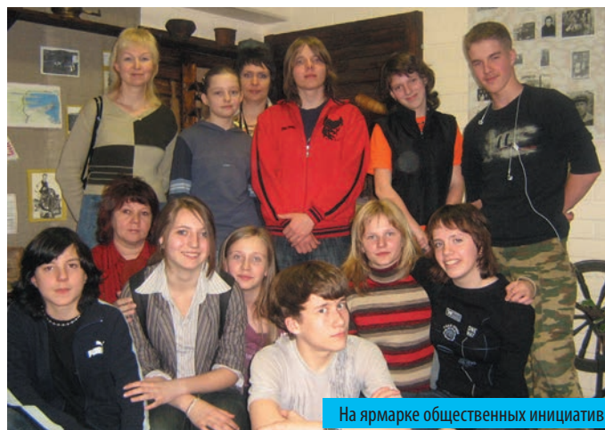
На ярмарке общественных инициатив