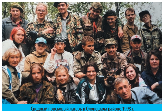
Сводный поисковый лагерь в Олонецком районе 1998 г.