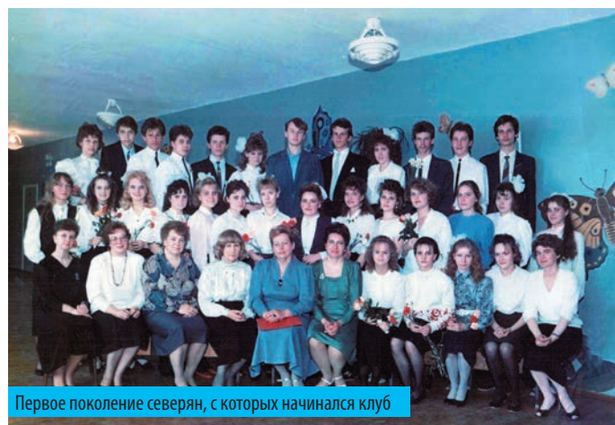
Первое поколение северян, с которых начинался клуб