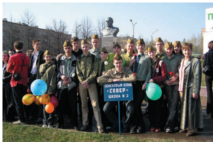
Третье поколение – выпуск 2005